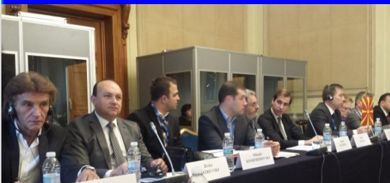
Претседателот д-р Митревски на тркалезната маса