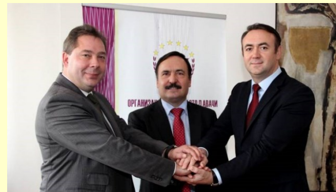
Социјалните партнери по потпишувањето ан КД за енергетика