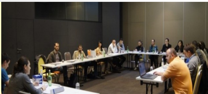
Учесници на состанокот на Одборот на Млади РСС „Солидарност“

По завршување на паралелните состаноци се одржа и една заедничка седница. На оваа седница присуствуваа и претставници од Меѓународната и Европска конфедерација на синдикатите, Меѓународна организација на трудот и други гости.