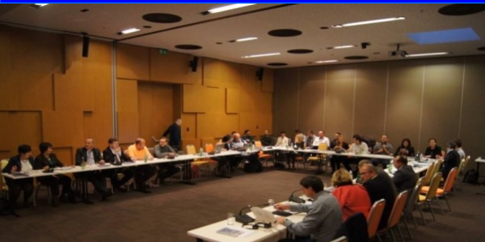
Учесници на состанокот на Регионалниот синдикален совет „Солидарност“