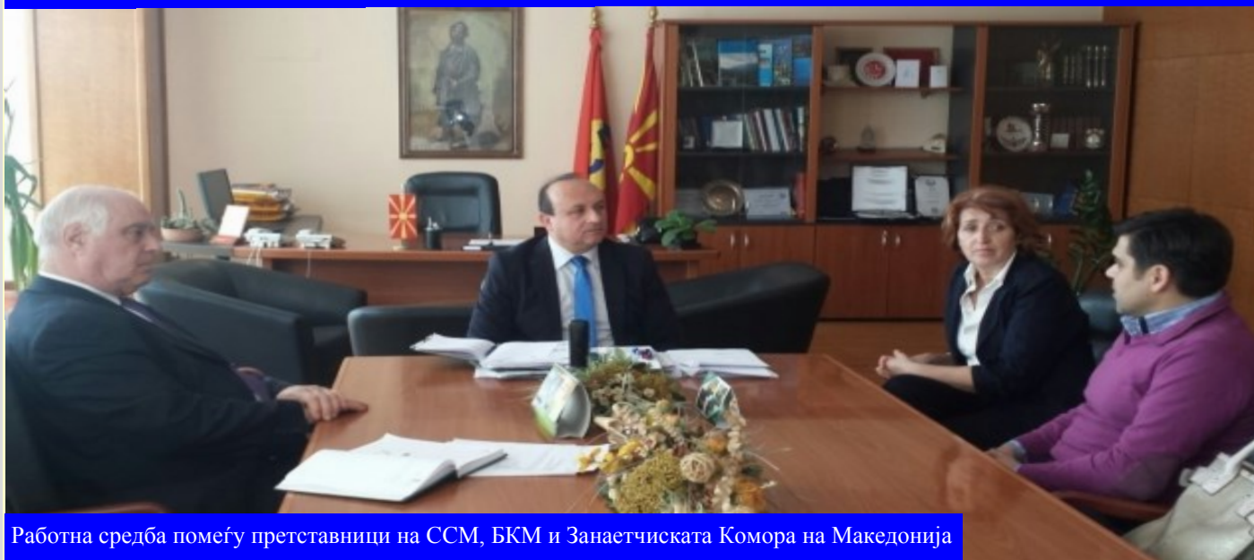
Работна средба помеѓу претставници на ССМ, БКМ и Занаетчиската Комора на Македонија