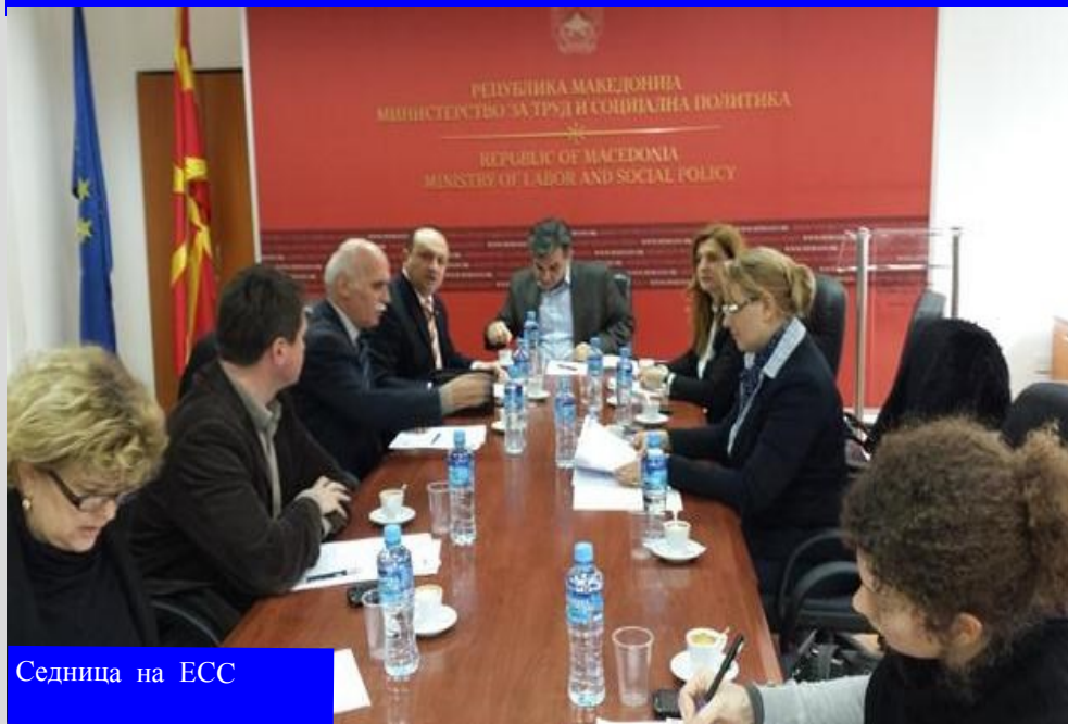
Седница на ЕСС