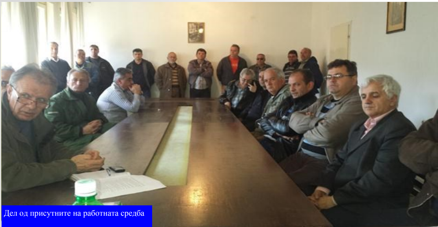
Дел од присутните на работната средба

Беше истакнато дека е решен проблемот и ќе се реализира донесената одлука за исплата на тереснки додаток. Ќе се реализира и ажурурањето на Х.Т.З опремата, а во фаза на обновување е и возниот парк. Од страна на помошниците на директорот на ЈП Македонски Шуми, присутните беа запознаени со начинот на реализација на дотурот на гориво и мазиво, исплатата на додатоките, менаџирањето во подружниците и потребата од редовна комуникација меѓу структурите во подружниците и сл.